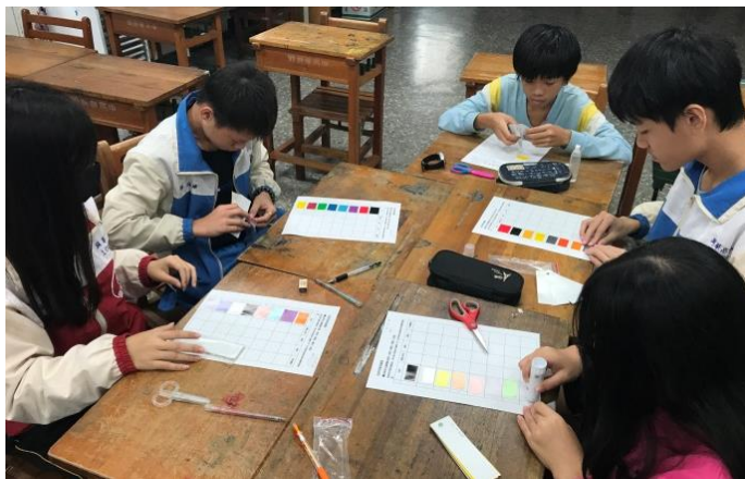
·色彩印象與感覺學習單