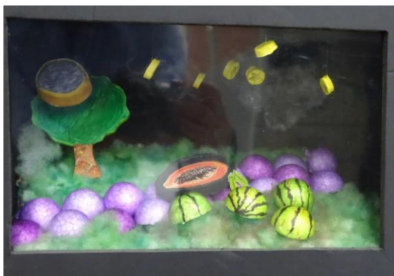
以太平農產品為題，呈現在地文化之美。