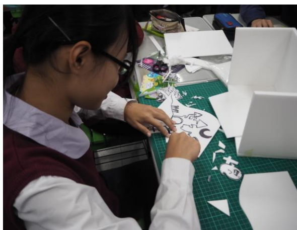
學生進行故事箱內部元件製作， 從做中學，體現美的感知。