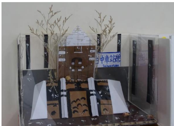
以臺中車站為題，展現臺中歷史刻痕。