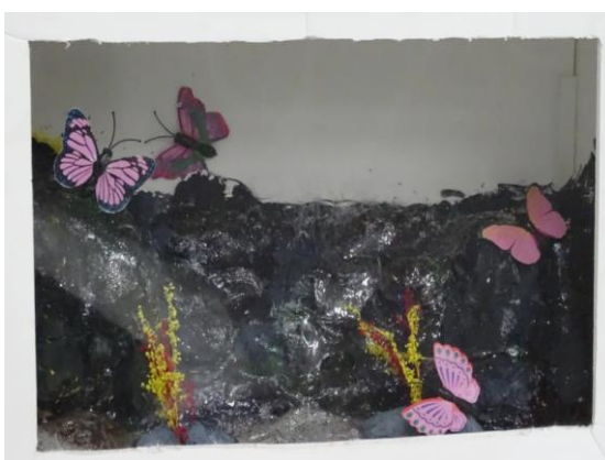
以紫斑蝶為主題，呈現在地景色之美