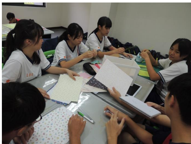
學生進行故事箱內容討論， 學習將在地文化質感展現。