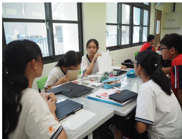
學生進行故事箱元件擺放討論， 學習質感與空間之搭配。