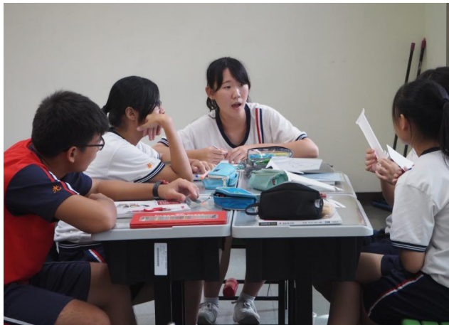
學生分組討論在地文化呈現方式， 發掘在地文化的特色與質感。