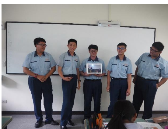
學生作品分組報告， 體現生活美感之運用。