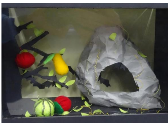
以頭汴坑農產品為題，呈現素材質感。