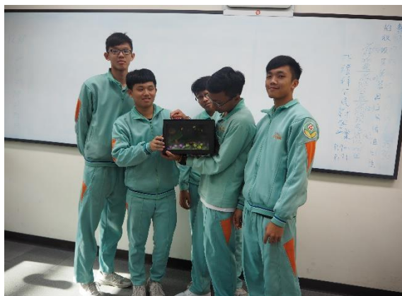
學生作品分組報告， 結合物件質感表現創作理念。