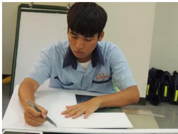
學生進行主題設計構圖， 體驗曲線造型之美。