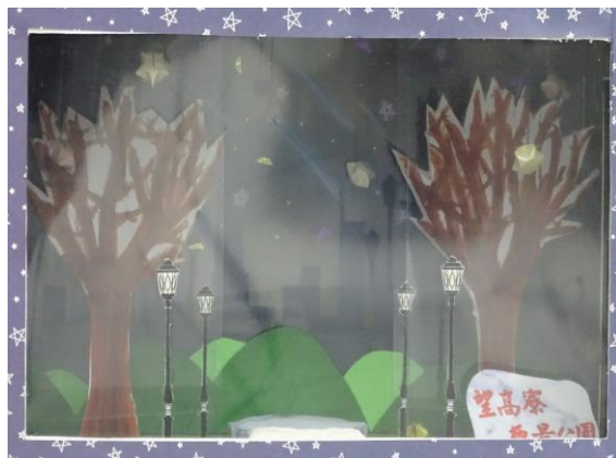
以望高寮夜景公園為題，呈現夜景之美。