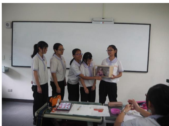
學生作品分組報告， 說明在地文化質感運用。