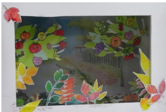
以太平三汀山景色為題，體現心靈美感。