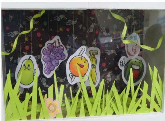
以水果農產品為題，透過景深呈現質感。