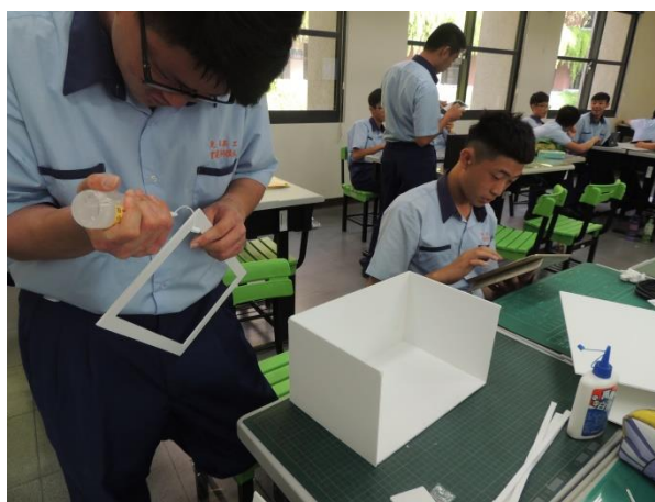
學生進行故事箱架構製作， 學習空間比例概念。