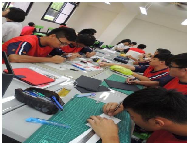
學生進行作品造型設計， 體驗造型之美。