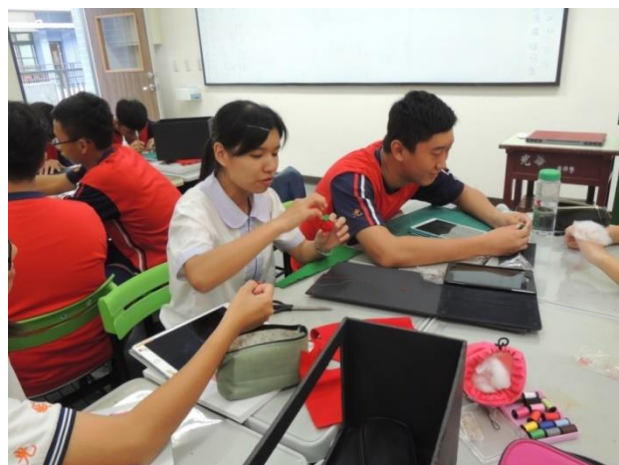
學生進行不同質感塑型活動， 體驗質感的運用與意象的表徵。