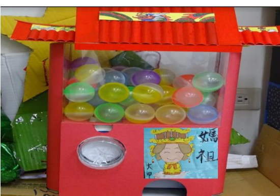
以大甲媽祖為題，透過素材色澤變化呈現繞境文化美感。