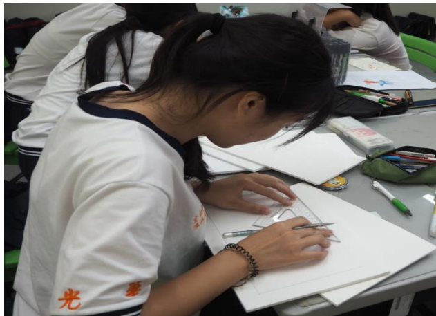
學生運用幾何繪圖工具進行構圖， 學習幾何黃金比例之美。