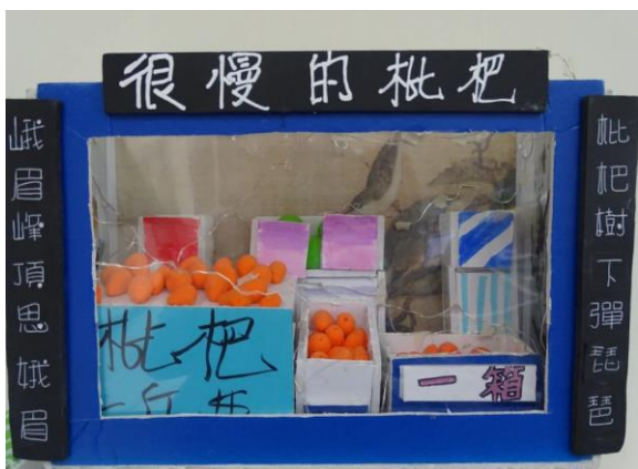
以素材質感，呈現枇杷生長歷程的可貴。