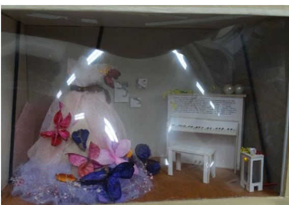
以婚紗店為題，呈現臺中婚紗產業之美。