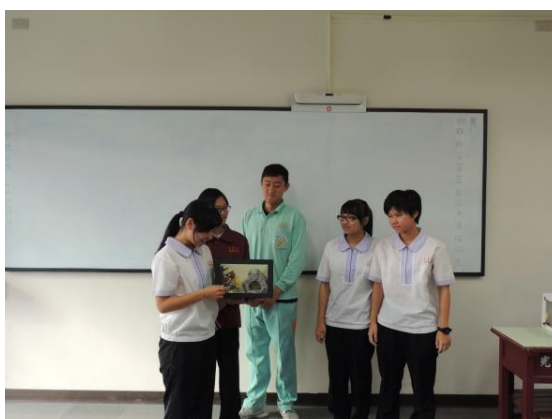
學生作品分組報告， 呈現空間美感概念。