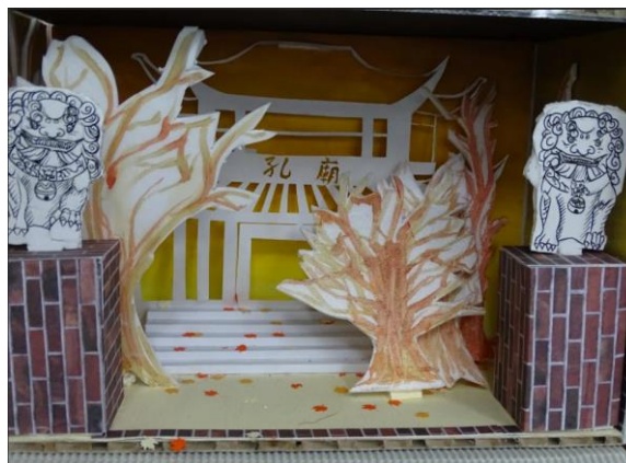
以孔廟為主題，體現傳統尊師文化之美。