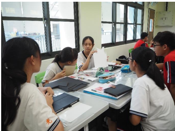
學生分組討論主題設計， 透過空間概念產生設計圖像。