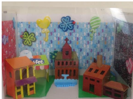
以臺中第一個教堂- 柳原教堂為題 呈現教堂建築美的感知。